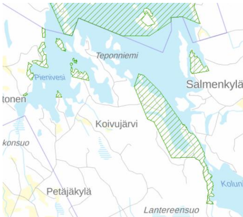
Kuva 3: Ranta-asemakaavojen alueet

Suunnittelualueella on kolme voimassa olevaa ranta-asemakaavaa: Koivujärven ranta-asemakaava, Kalttosen tilan ranta-asemakaava ja Eräniementilan ranta-asemakaava. Kaikki kaavat sijoittuvat Koivujärvelle. Ranta-asemakaavat ovat yksityiskohtaisempia kaavoja ja ne ohjaavat rakentamista, vaikka alueelle laaditaan yleiskaava.