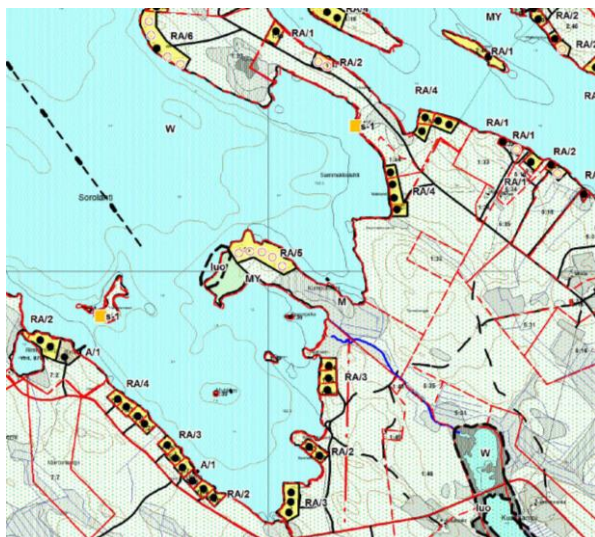
Kuva 4: Ote Nilakan ja kunnan eteläosan rantaosayleiskaavasta.

Alueella on voimassa Nilakan ja kunnan eteläosan rantaosayleiskaava (kuva 4 oheassa).