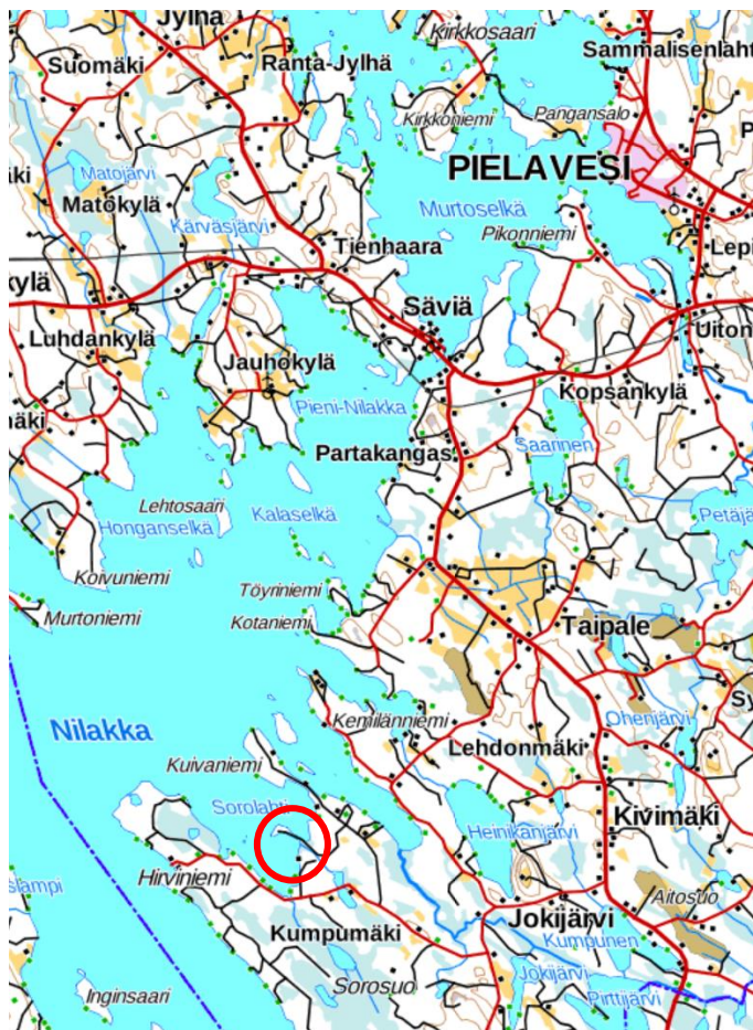
Kuva 1: Suunnittelualue merkitty punaisella ympyrällä.

Suunnittelualueen sijainti ja rajaus esitetty oheisissa kuvissa 1 ja 2.