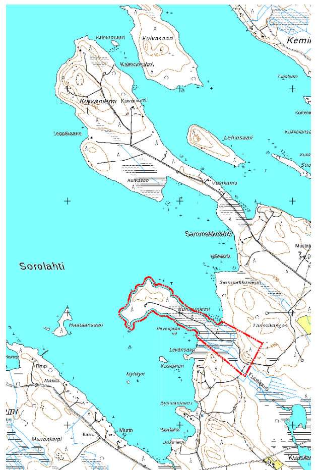
Kuva 2: Suunnittelualueen rajaus punaisella viivalla.